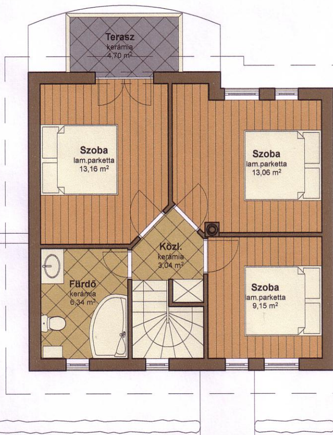
L a k á s 2.